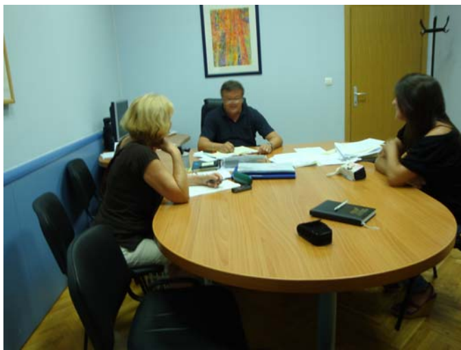
Besprechung im Rathaus von Sibenik

Das Gespräch im Bürgermeisteramt war auch positiv, obwohl weder der Bürgermeister noch sein Stellvertreter zugegen waren. Unser Gesprächspartner – ein Sachbearbeiter – hat zugesagt, ein Stück Land für den Verein ausfindig zu machen. Inzwischen soll der Verein „Dalmatiner“ sich eintragen lassen und einen Antrag mit Projektbeschreibung abgeben. Hier werden sicherlich noch viele Gespräche notwendig sein, bis der Verein eine eigene Anlage in Angriff nehmen kann.