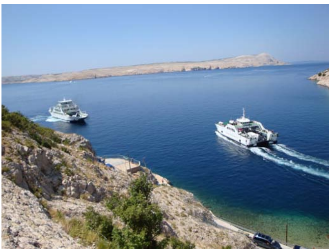
Fähre zur Insel Rab

2 Std von Samobor bis zur Abzweigung zur Fähre nach Rab (Jablanac) – etwa 800 Autos vor mir, die alle auf die Insel wollen. Noch einmal 2,5 Std für 4 km und ich habe es geschafft (4 Fähren mit einer Kapazität von jeweils etwas über 40 Autos, wenn kein Bus dazwischen kommt, 110 HKN die einfache Strecke)