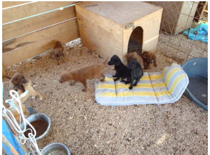
Welpen in Benkovac

Kroatischer Nationalfeiertag. Auf der Fahrt nach Pula in Benkovac haltgemacht. Die Anlage beherbergt 26 Hunde davon 9 Welpen. Sie ist nicht schlecht, macht aber insgesamt einen ungepflegten Eindruck. Die Dächer der Holzhäuser haben immer noch keine Dachpappe o.ä., was zur Folge hat, dass es durchregnet, überall liegt Hundekot herum, eine Hundehütte fällt auseinander und wird nicht repariert, die Hundehütten sind nicht gereinigt. Insgesamt müsste die Anlage systematisch überholt werden. Würzburg hilft offenbar stetig. Die meisten Hunde sind kastriert und gechippt. Ein Bekannter von mir, der auch zugegen war, wird sich jetzt regelmäßig kümmern und dem Tierpfleger dort helfen. Einen Welpen hat er gleich mit zu sich nach Hause (Vrana) genommen Ein Overall und Arbeitshandschuhe habe ich Jure gegeben. Kontakt zum Verein in Sibenik besteht.