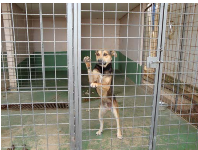
Er fand noch am gleichen Tag ein neues zuhause in Wien

Er hat auf der Insel Krk eine Pflegestelle gefunden. Als Auffangstation ist diese Anlage ganz i.O. Es fehlt all das, was den Tieren wohl tut, anständige Behandlung, hin und wieder etwas Auslauf, med. Versorgung, ein Platz aus Holz zum Liegen und vernünftiges Futter. Als TH ist sie völlig ungeeignet.