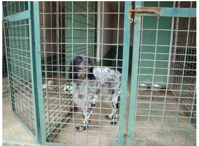
Engl. Setter „Tom“ vor seiner Befreiung