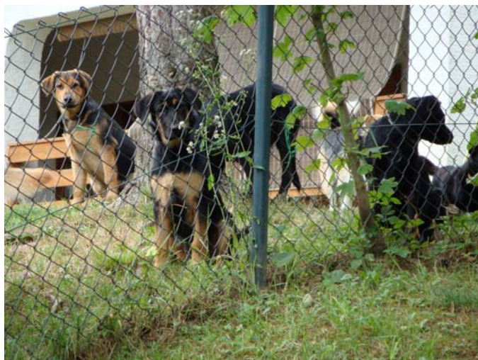
Welpen im Garten der Vorsitzenden von „Sapica“

Bei Sapica in Zapresic halt gemacht, ein paar Spenden abgeliefert und die vielen neuen Hunde im Garten der Vorsitzenden bewundert. Sie hat jetzt noch zusätzlich 4 reizende Welpen aufgenommen, für die sie ein neues Zuhause sucht.