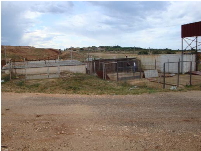
„Sinteraj“ in Pula

Die Müllhalde Pula/Kastijun mit Sinteraj und Fort gesehen. Die Sinteraj besteht aus 2 Reihen Boxen (6 und 4) Sie waren mit 4 Hunden belegt, davon wurde gerade einer abgeholt. Ich habe dann noch einen engl. Setter erlöst und mit nach ZG genommen.