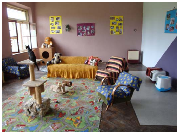
Katzenhaus in Lovran