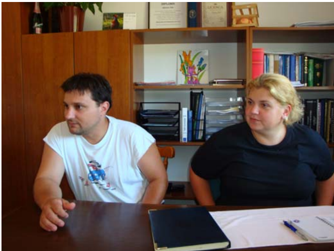
Tierarzt mit Biologin

Das Gespräch im BM-Amt war außerordentlich freundlich. Resultat: Wir werden für Rab einen Antrag zur Einrichtung einer Auffangstation für Katzen und Hunde erarbeiten – alternativ ein Kastrationsprogramm für Katzen, was dann als Vorgang im BM-Amt kurzfristig bearbeitet wird.