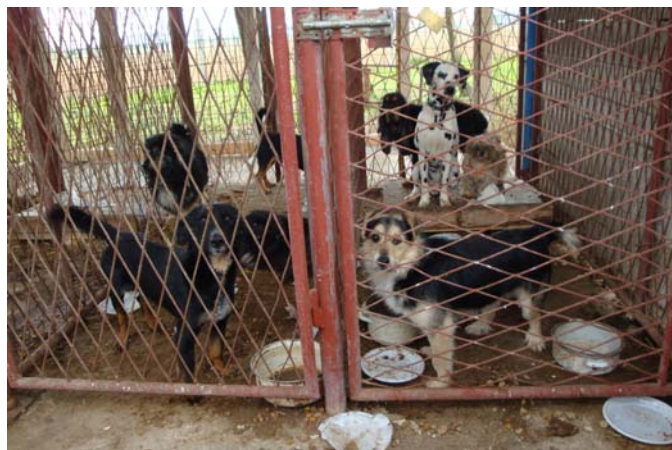
„Sinteraj“ in Pozega

gebnis meines Besuchs im April hat der zuständige Inspektor am 25. Mai den Verantwortlichen zur Auflage gemacht, binnen 120 Tagen die Anlage entweder zu schließen oder einen Shelter den Auflagen entsprechend anzulegen.