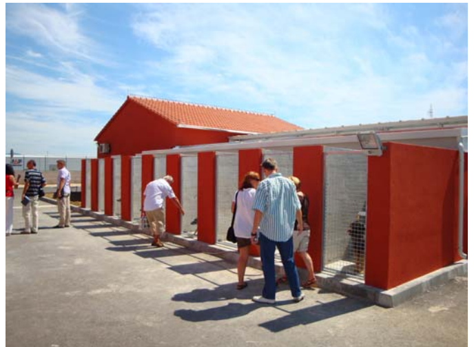
9 Einzelboxen – Außenbereich- des Hundehotels