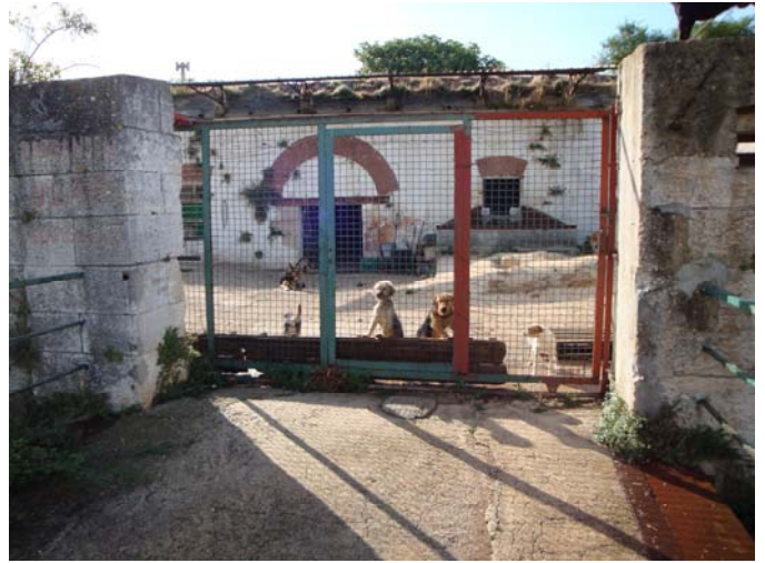
Wilde Sammelstelle im alten Fort „Kastijun“

Das Fort dient weiterhin, obwohl untersagt, als Sammelstelle für Hunde. Die Hunde haben keine Hütten, liegen auf Beton und werden nach Aussagen des dortigen Vereins nur mangelhaft ernährt. Auch hier muss etwas nachhaltig geschehen.