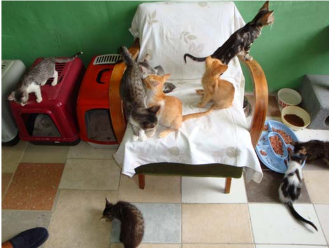
„Kinderstube“ in Lovran

Es war wirklich beeindruckend mit wie viel Energie und Herz dort alles katzensgerecht gemacht worden ist und weiter entwickelt wird. Z. Zt haben sie 63 Katzen, davon 8 Erwachsene.