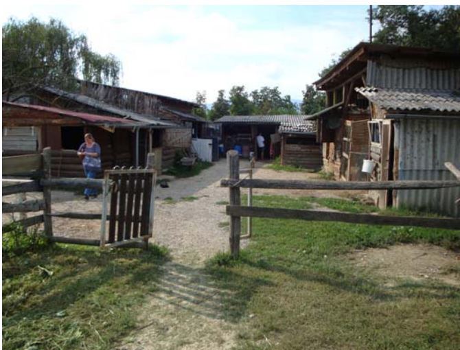
Die Farm am Stadtrand von Zagreb

Nachmittags mit der Vorsitzenden von „Sapica“ eine Anlage in Zagreb besucht, die alle möglichen Tiere beherbergt – Pferde, Hunde, Katzen. Die Anlage selbst sieht ziemlich heruntergekommen aus, viele Hunde sind an der Kette, viele Katzen sind krank, die Pferde und 2 Ponys sind angebunden und stehen in Ständern, was in Deutschland seit 30 Jahren verboten ist. Jedoch sehen die Pferde gut gepflegt aus und die Hunde sind trotz Kette nicht aggressiv. Es sind 19 Pferde und etwa 25 Hunde. Die Frau, die das Ganze auf gepachtetem Land bewirtschaftet, ist etwa 56 Jahre alt und nimmt leider keine Hilfe an.